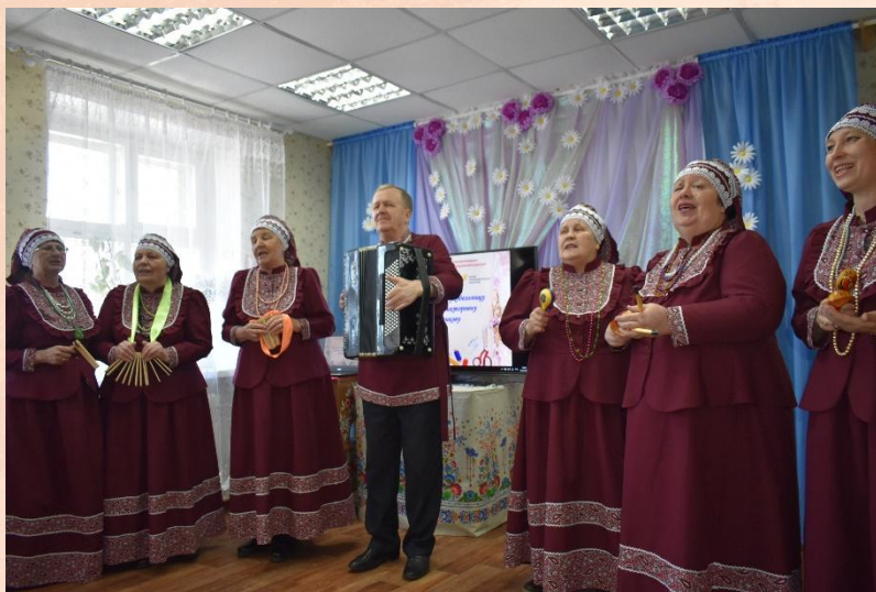
Вокальный ансамбль «Раздолье» Центра «Радость»