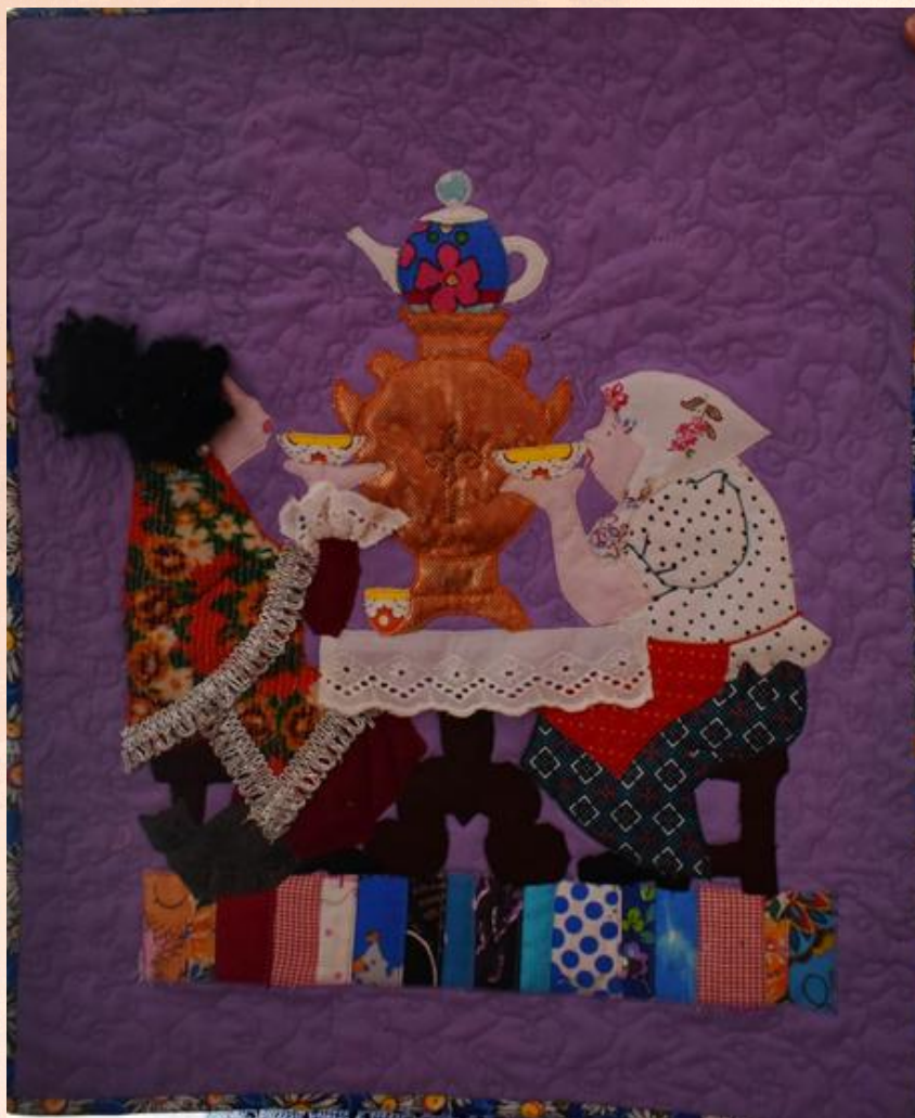
Панно в купеческую гостиную «Чаепитие у купчихи»