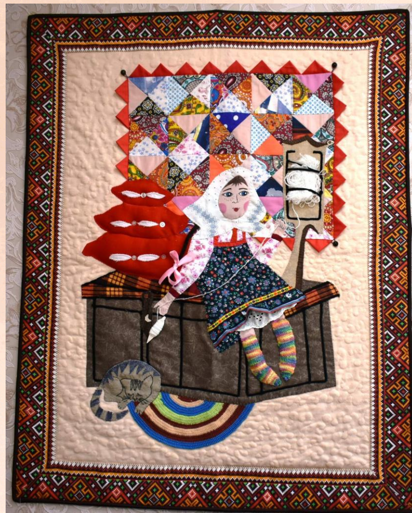
Реализация проекта «Бабушкин ситцевый сундучок»