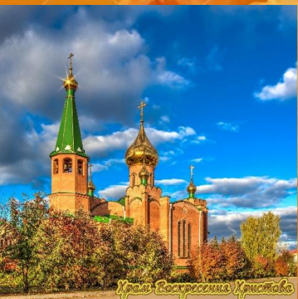
Храм Воскресения Христова